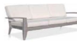
22143 Трехместный диван Sofa