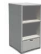
2139 Витрина Display cabinet