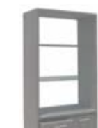
2388 Витрина Display cabinet