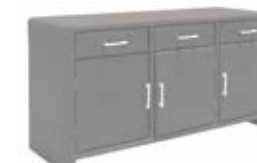
2390 Буфет Sideboard