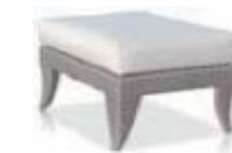
22146 Банкетка Ottoman