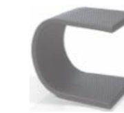
2985 Стол для лежачка Aux. table