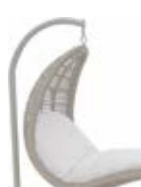
2987 Качели Hanging chair