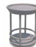
2990 Сервировочный стол Trolley