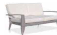
22142 Двухместный диван Loveseat