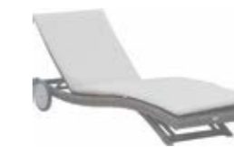
2984 Лежак Lounger