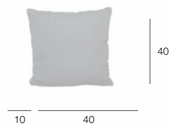
22840 Подушка Pillow