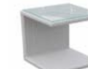
2935 Стол для лежачка Aux. table